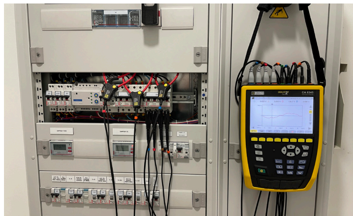
Analizador de potencia y calidad de energía, Qualistar Clase A, CA 8345

«A pesar de realizar un mantenimiento preventivo regular conforme a las recomendaciones del fabricante, que incluía controles semanales, nos enfrentábamos a un problema recurrente: la puerta se bloqueaba de forma aleatoria, lo que hacía que su uso fuera impredecible. Un lado de la puerta se atascaba, impidiendo cualquier descenso. Mecánicamente, todo estaba en orden. Perdíamos tiempo, disponibilidad y corríamos el riesgo de una parada completa.»